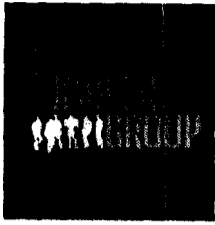
IMAGEN GROUP SPA

Giro: ARTICULOS PUBLICITARIOS E IMPRESION DE PUBLICIDAD AV. LIBERTADOR BERNARDO 1302 70- SANTIAGO eMail : CONTACTO@IMAGENGROUP.CL Telefono : 2 25558513