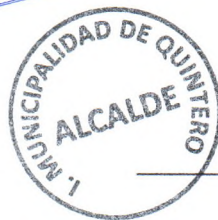
V°B° Sr Alcalde