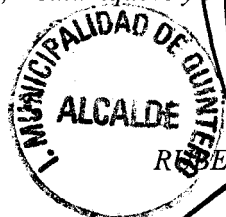
RODOLFO GUTIERREZ CABRERA ALCALDE (S)