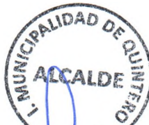
Mauricio Carrasco Pardo Alcalde Municipalidad de Quintero