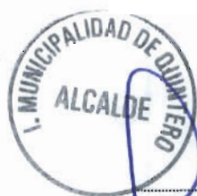
MAURICIO CARRASCO PARDO Alcalde de la comuna I. Municipalidad de Quintero